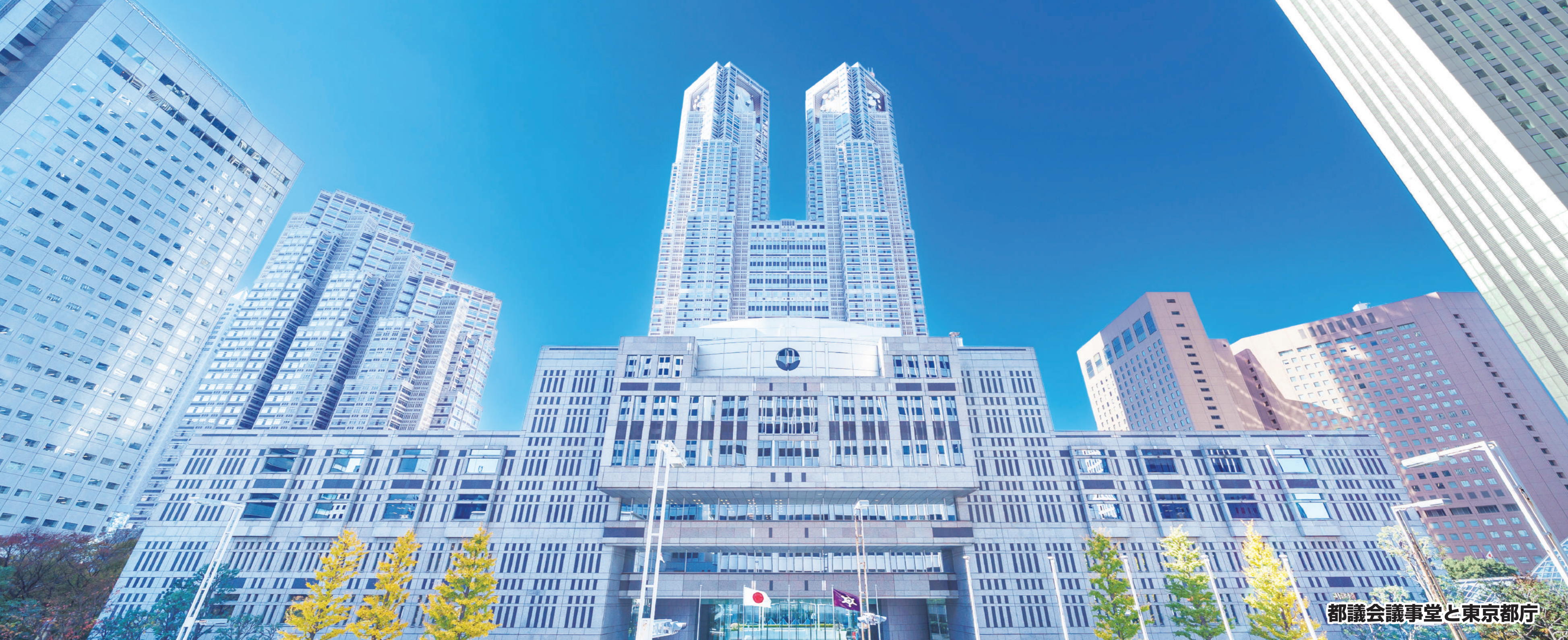
都議会議事堂と東京都庁