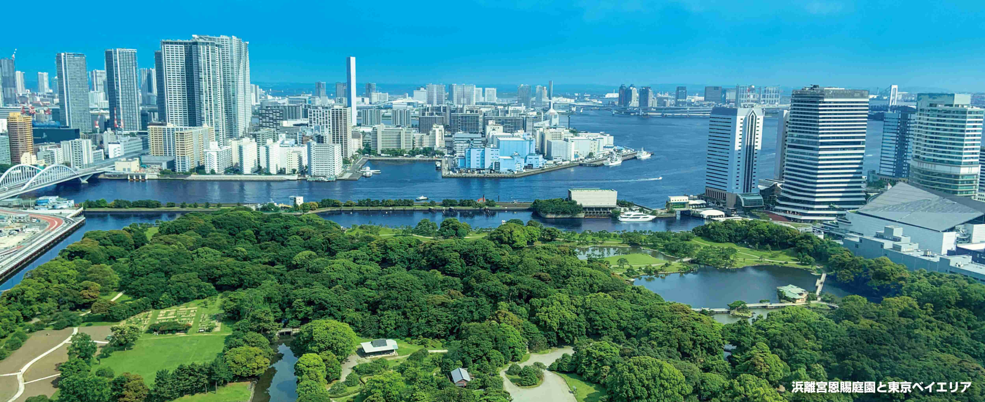
浜離宮恩賜庭園と東京ベイエリア