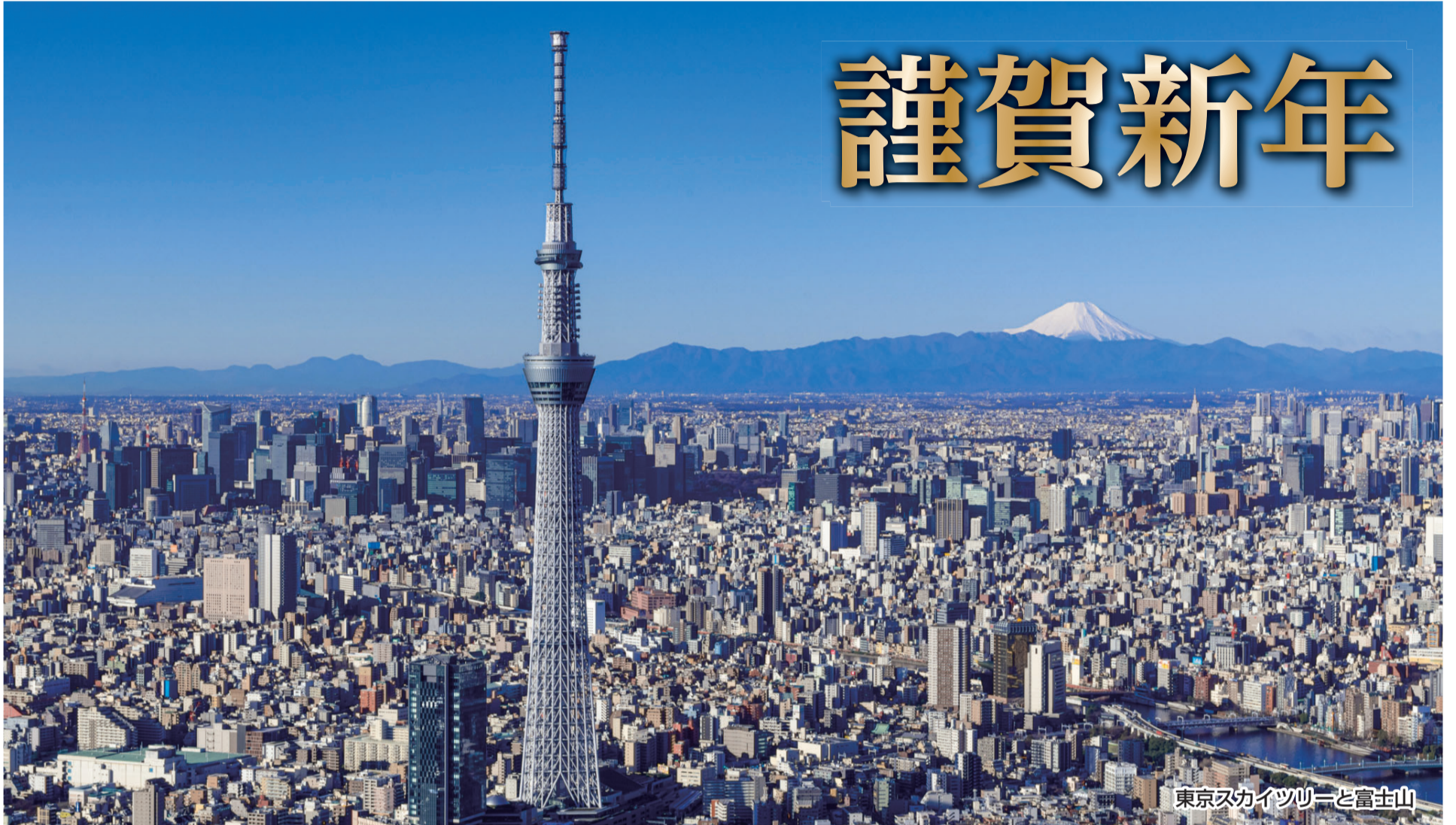
東京スカイツリーと富士山