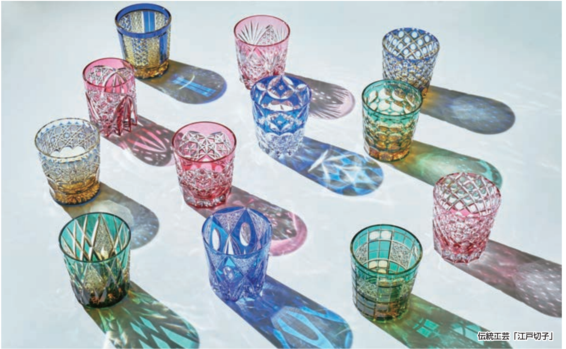
伝統工芸「江戸切子」