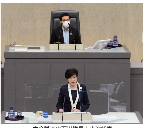
本会議での石川議長と小池知事