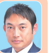
川松 真一郎 (自民党)

* スマートインターチェンジ：高速道路の本線やサービスエリア等から乗り降りできるように設置され、通行可能な車両をETC搭載車両に限定しているインターチェンジのこと。