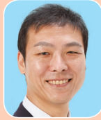
関野 たかひろ (都ファースト)

【横田基地】周辺の防疫対策に万全を期すために、国により強く働きかけるべき。見解は。知事 万全の措置と感染状況等の提供を国や米軍に要請。今後も必要なことを申し入れる。