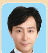
ひぐちたかあき (都ファースト)

リカレント教育 現役世代も対象とした教育の環境づくりに、総合的に取り組むべき。知事 議論を重ね、元年末をめどに策定する長期戦略ビジョンに具体的な政策を盛り込む。首都大学東京 ソサエティ5.0に対応している人材の育成、輩出を検討すべし。総務局長 学科開設等、先端分野の人材育成に着手。急速なIT技術の進展を見据え検討。電動キックボード 実用化に向け、都立公園等での実証実験に官民連携し取り組むべき。戦略本部長 機運醸成へ、都立公園等で安全性に十分配慮し、試乗体験会等の実施を検討。