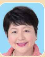
のがみ 純子 (公明党)

都市力の強化 幼い子供を持つ親世代の防災意識の向上に取り組みを。利用者10万人未満の駅のホームドア設置、利便性の高いバリアフリールート実現に向け支援拡大を。