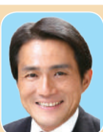
鈴木 章浩 (自民党)

都市力の強化 幼い子供を持つ親世代の防災意識の向上に取り組みを。利用者10万人未満の駅のホームドア設置、利便性の高いバリアフリールート実現に向け支援拡大を。