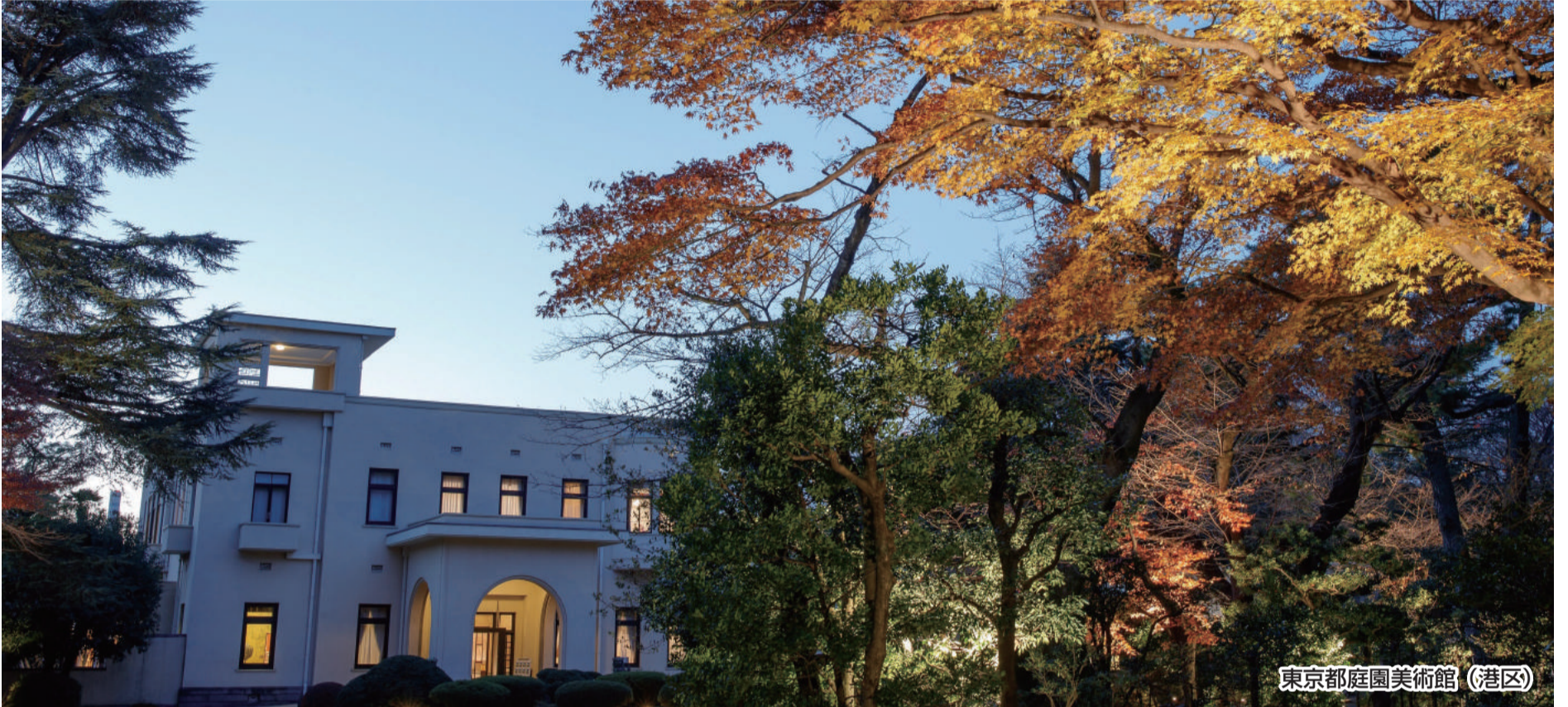
東京都庭園美術館 (港区)