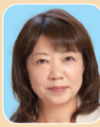
とや 英津子 (日本共産党)

都市力の強化 幼い子供を持つ親世代の防災意識の向上に取り組みを。利用者10万人未満の駅のホームドア設置、利便性の高いバリアフリールート実現に向け支援拡大を。