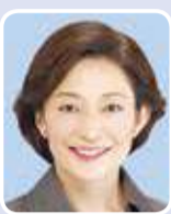
まつば多美子 (公明党)

し、民間のノウハウも生かし都庁全体で実施。〈都市政策〉①神宮外苑地区の開発計画への決意は。②鉄道ネットワーク充実への決意は。知事 ①大会後の抜本的な再整備について関係者と協議開始。景観と調和したスポーツのメッカとする。②長期的視点に立ち、各路線の採算性や空港アクセス等の課題を取りまとめ、国の審議会答申への反映を働きかける。〈木密地域〉特定整備路線内側地域の改善を。都市整備局長 建ぺい率緩和による建て替え促進や容積率最高限度を設定して敷地共同化を誘導する等住宅等の密集に歯止めをかける。〈水素社会の実現〉東京五輪の輸送手段として、燃料電池バスの導入と普及に向け取組を。交通局長 車両開発実証実験への協力等によりメーカーの早期開発を促すとともに、東京五輪に向け都が率先して導入し、普及を促進。〈自然公園のルール作り〉民間事業者との連携等様々な機会捉え、ルール浸透を図るべき。環境局長 環境関連のイベントや鉄道事業者等と連携したキャンペーン等により普及啓発等。〈多摩の地域振興〉インフラ整備の推進を。東京都技監 幹線道路ネットワーク整備による利便増進や自然条件等の特性を踏まえたモデル整備、無電柱化事業等の取組を加速。〈都市農業特区〉実現を強力に進めるべき。産業労働局長 自治体、農業会議等との協議により制度運用を検討。政令による特区対象区域指定等の改善を国に強く働きかけていく。