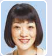
和泉 なおみ (日本共産党)