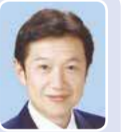
堀 宏道 (自民党)

〔池袋駅周辺の都市再生〕知事の所見は。知事 緊急整備地域への指定を国に申請し、木密地域の改善を一層推進。また、芸術文化を感じられる歩行者中心の都市空間を創出。