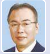
桜井 浩之 (自民党)

〔連続立交差事業〕京浜急行本線の品川駅から北品川駅付近における事業の取組は。東京都技監 品川駅再編に併せ事業を実施する。27年度は事業範囲等の調査検討に着手。