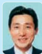
こいそ 明 (南多摩) 環建