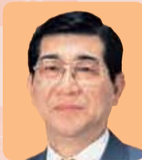
東京都議会副議長

新しい一年が始まります。今年もお元気で明るい毎日でありますよう、お祈り申し上げます。昨年の最大の都政の変化は、10月に開業しました羽田空港の新滑走路の国際線ターミナルの実現でしょう。東京にかぎらず首都圏をはじめ日本全土に人の流れ、モノの流れ、情報の流れを劇的に増加させるに違いありません。東京がかねてから熱望してきました最大懸案の一つです。世界の主要都市と直通することによる経済的、文化的効果は測り知れません。都民も企業もこれを機会と捉えて、積極的に世界に飛躍していただきたいものです。