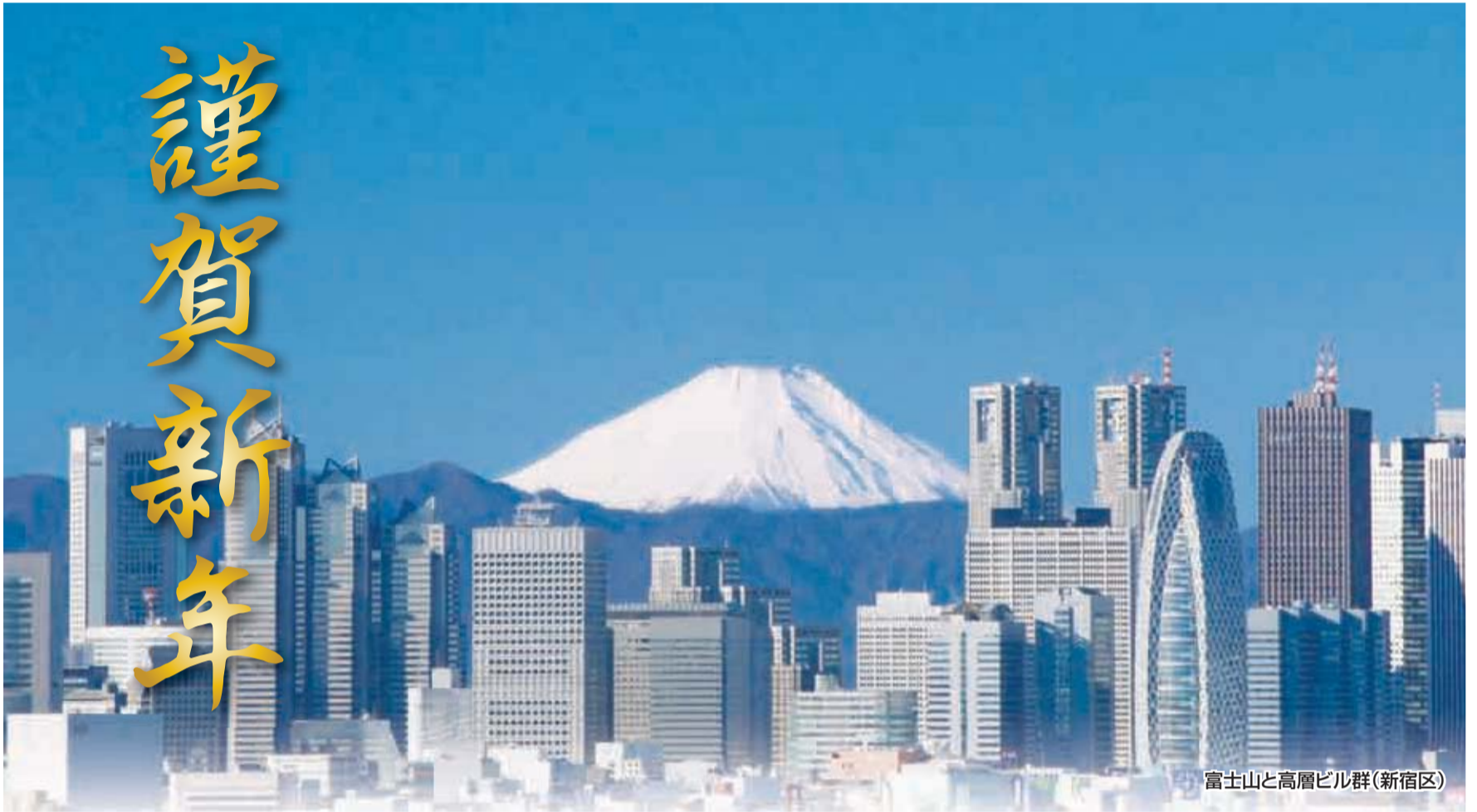
富士山と高層ビル群(新宿区)

4面 ☆わが会派 今年の抱負 ☆都議会用語解説 ☆都議会提供テレビ番組のお知らせ ☆平成23年第1回定例会の予定