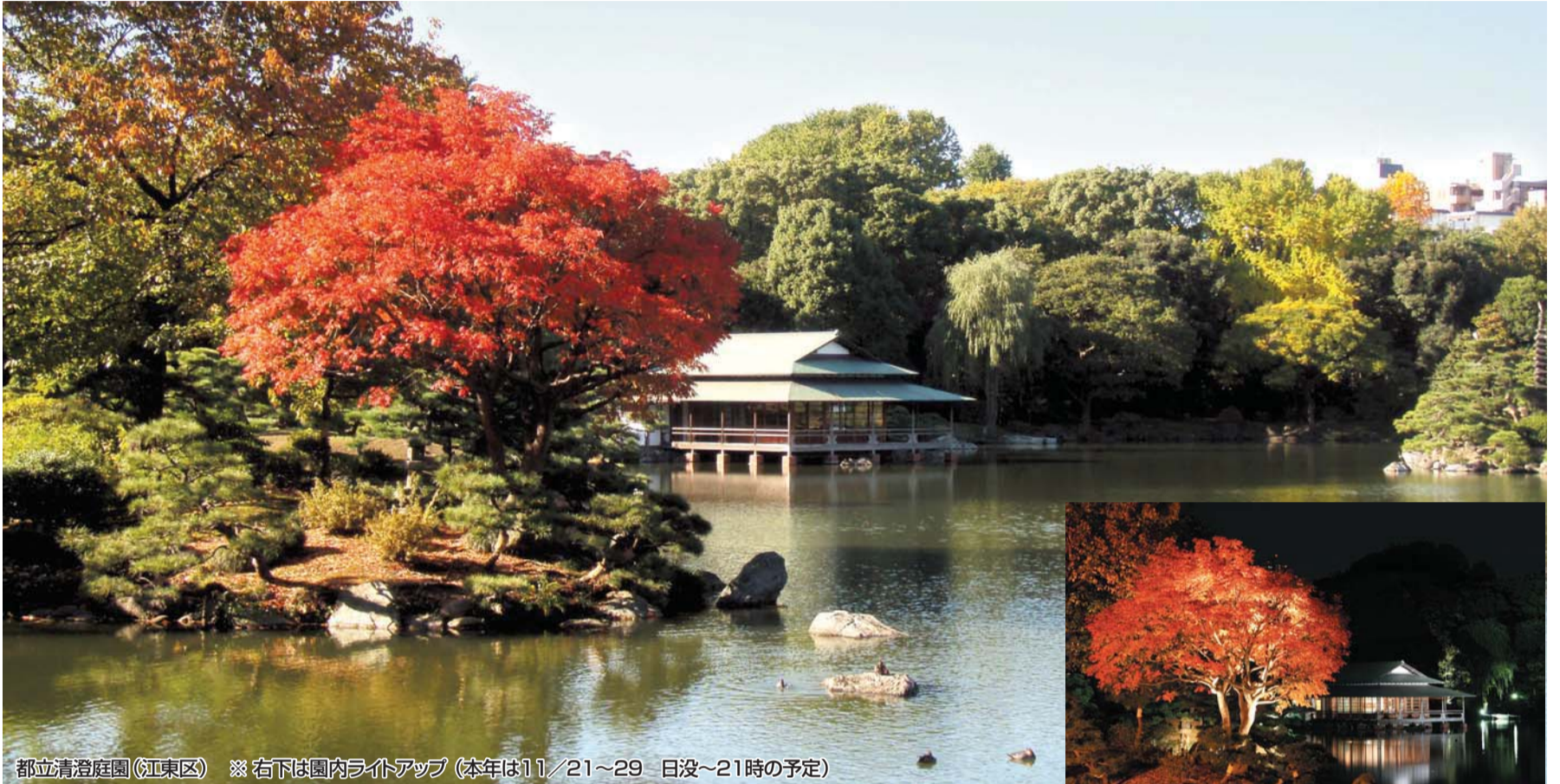
都立清澄庭園(江東区) ※右下は園内ライトアップ(本年は11/21～29 日没～21時の予定)