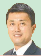
大沢 昇 (民主党)