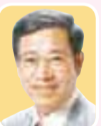
植木 こうじ 都議 (中野区)