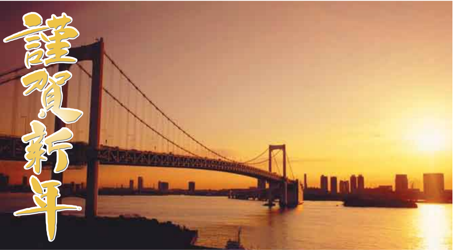
レインボーブリッジと朝明け