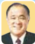
自民党 幹事長 高島 なおき