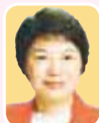
河野 百合恵 都議 (江戸川区)