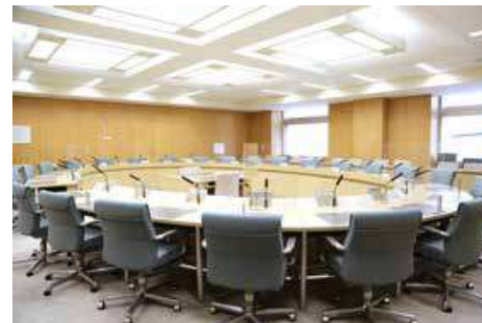
議会運営委員会室